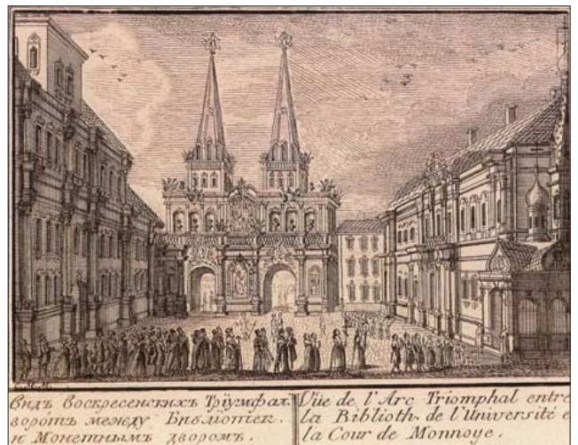
Воскресенские ворота и здание Красного монетного двора в Москве. Офорт. Вторая половина XVIII в.

Качество выпускаемой монеты поддерживалось на высоком уровне, и мастера должны были обладать вы-