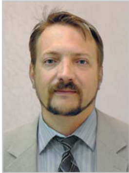
Кандидат исторических наук