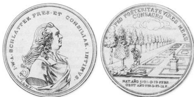
Памятная медаль, изготовленная в честь И.А. Шлаттера медальером И.-Г. Вехтером.

серебра пониженной против российской пробы, из которого обычно и чеканили подобную монету здесь ранее.