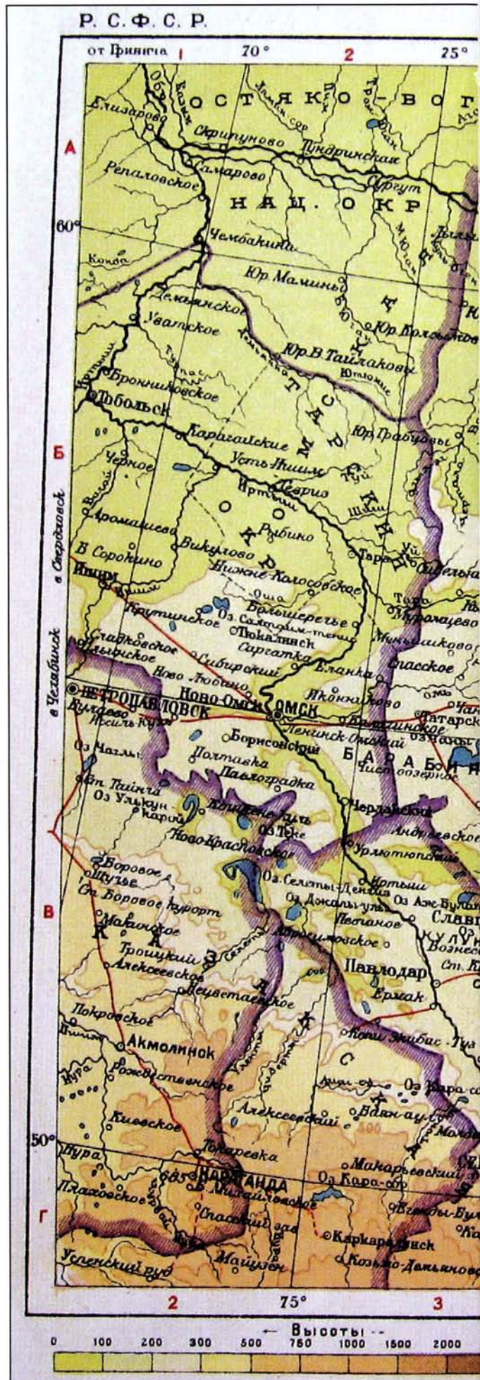
Западно-Сибирский край. Типографская карта из атласа, изданного в 1936 году

Следующим этапом процесса разукрупнения бывшего Сибирского края стало создание Алтайского края в сентябре 1937 года.