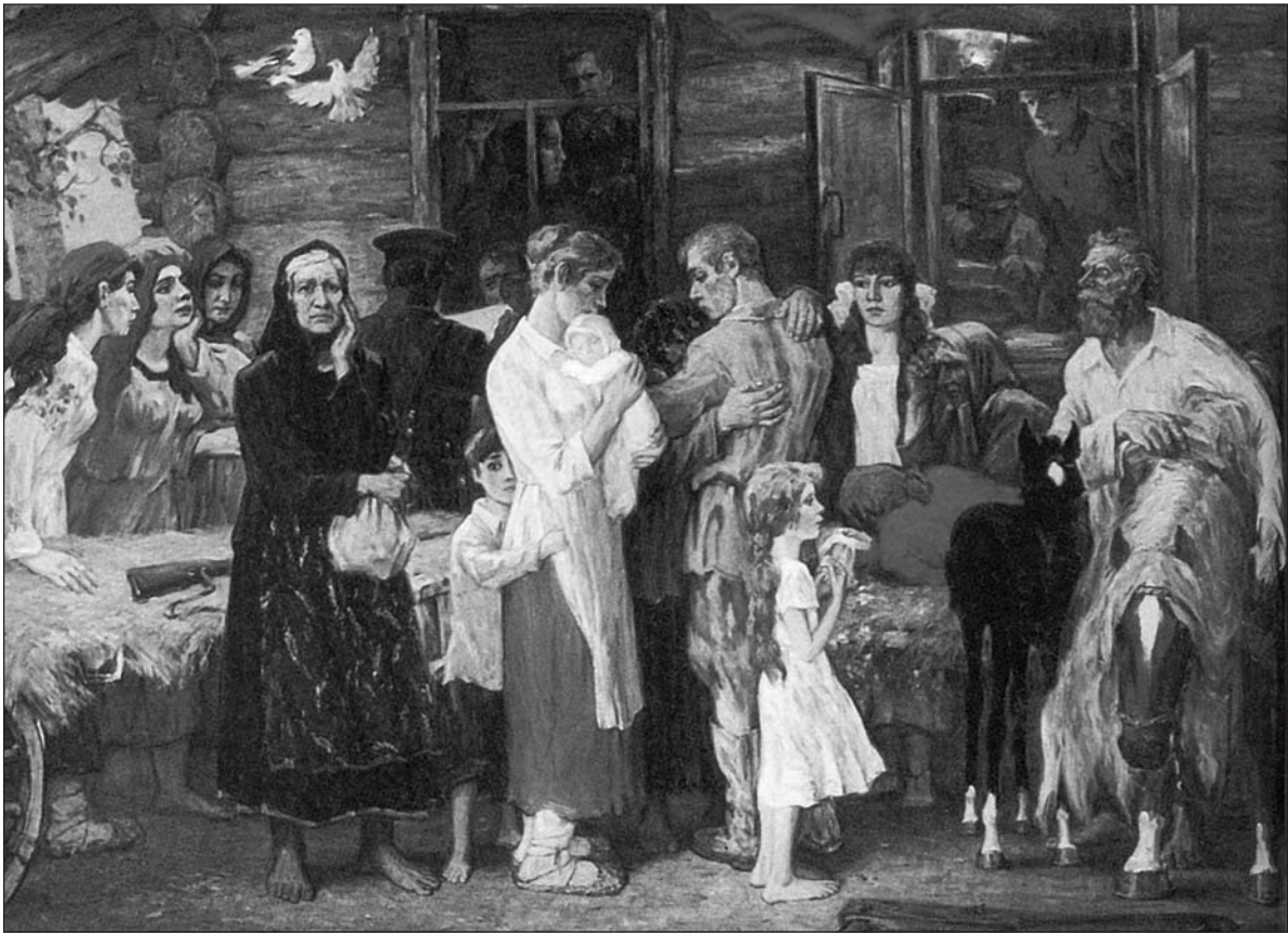
Хайрулинов И. С. Июнь сорок первого. Х., м. 186x258.

предприятия пищевой и деревообрабатывающей промышленности. Но самым главным условием успешного размещения эвакуированных предприятий было наличие развитой транспортной сети, связавшей Алтайский край накануне войны со всей страной.