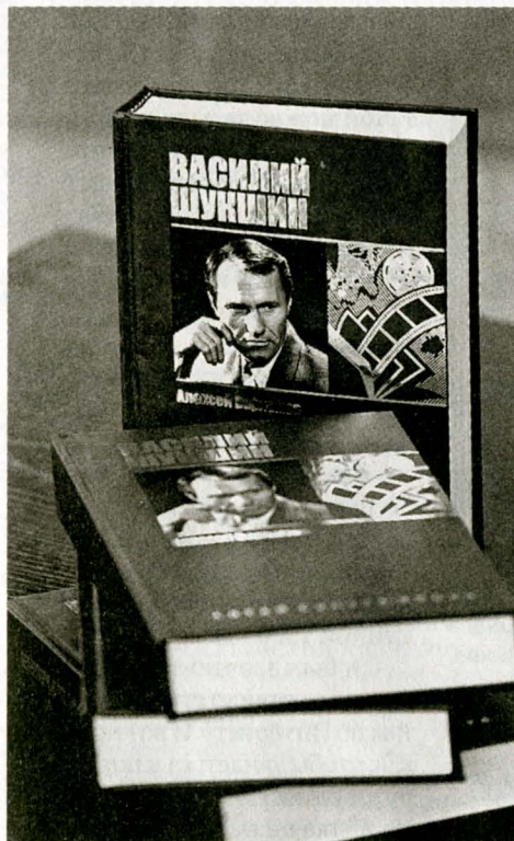
Книга «Василий Шукшин» – достойное украшение Шукшинских дней на Алтае.

– Презентация книги – достойное украшение юбилейных Шукшинских дней на Алтае, – сказал губернатор Александр