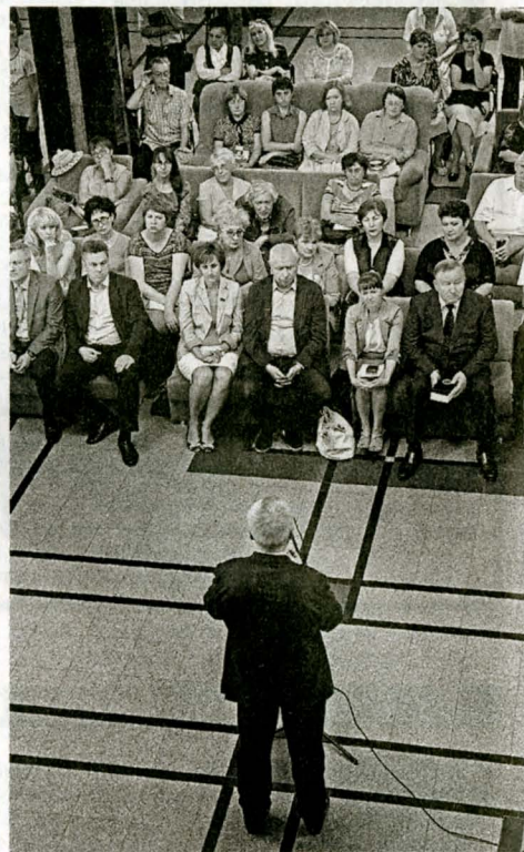
Презентация издания прошла в театре драмы.