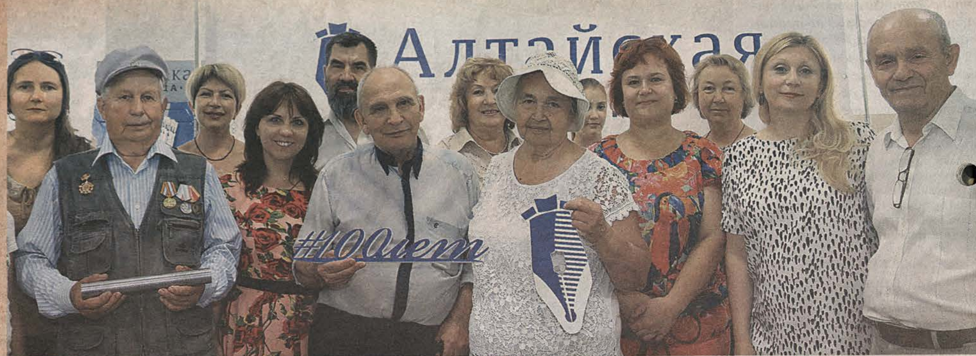
Поздравить газету с юбилеем пришли ветераны, музейные работники и постоянные читатели «АП».

Экспозиция, которая открылась в краевой столице в выставочном зале музея «Город», посвящена 100-летию «Алтайской правды».