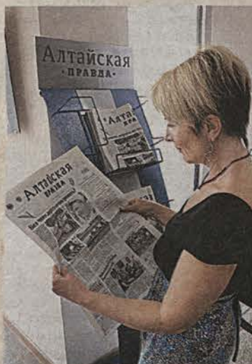
...а сегодня газету можно почитать у современных стоек.

они поделятся своими воспоминаниями, интересными историями из жизни газеты. Воспоминания ветеранов будут записаны и помещены в специальную капсулу, чтобы наши потомки через 50 лет смогли узнать об истории газеты из первых уст.