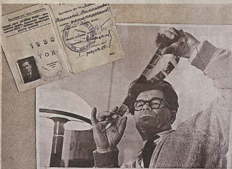
Из жизни советского фотокорреспондента.

4 июля в 11 часов на пр. Ленина, 111 состоится встреча ветеранов редакции газеты «Алтайская правда» с читателями «АП»,