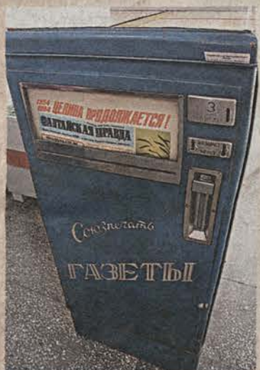
Вот в таких киосках покупали номер «АП» за три копейки...