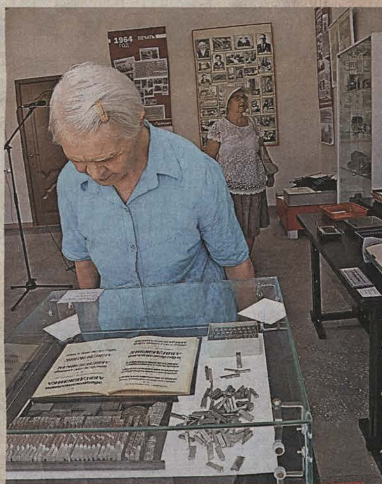
Посетители выставки с удовольствием изучали экспонаты.

Реализуется проект «Звезды поздравляют газету с юбилеем». Интервью записываются на глав-