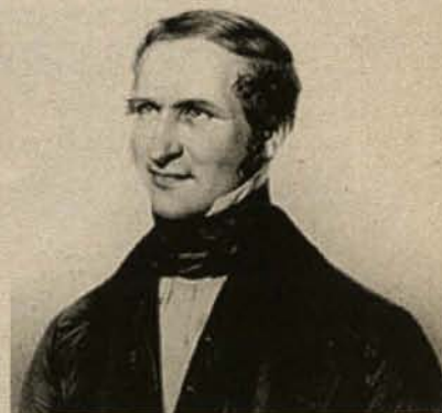
Густав Розе (1798–1873) – немецкий минералог и геолог; профессор минералогии в Берлинском университете, с 1856 года директор Минералогического музея.