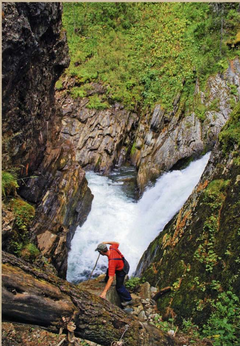
Инские водопады на территории заказника «Чарышский». Один из них неофициально носит имя А. Гумбольдта.