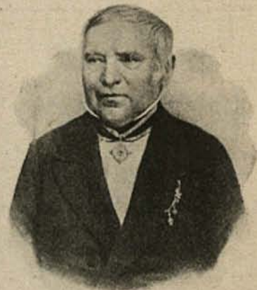
Христиан Готфрид Эренберг (1795–1876) – немецкий естествоиспытатель, зоолог, геолог, основатель микропалеонтологии, ботаник, миколог.