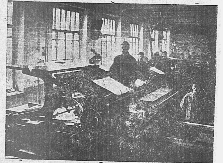
Одна из машин, на которой печатается «Красный Алтай»

Селькор—представитель нового слоя в деревне, того слоя, который через голову темных сил деревни хочет протянуть руку рабочему классу, его авангарду, подлинной коммунистической партии.