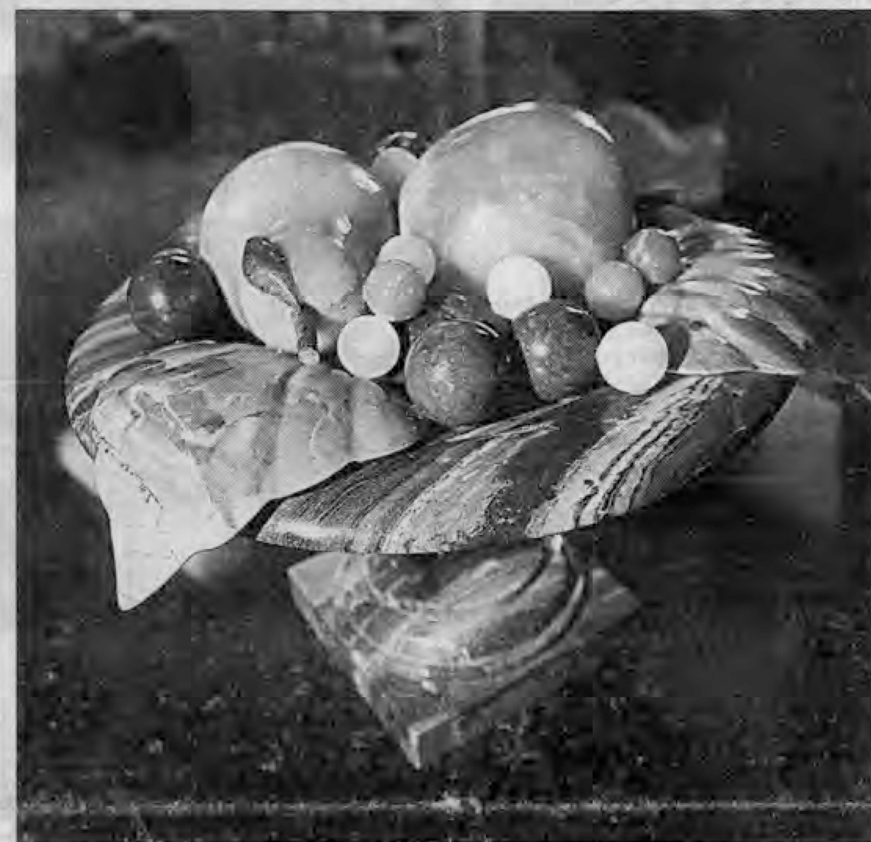
Красивы фрукты - а не укусишь... камни!