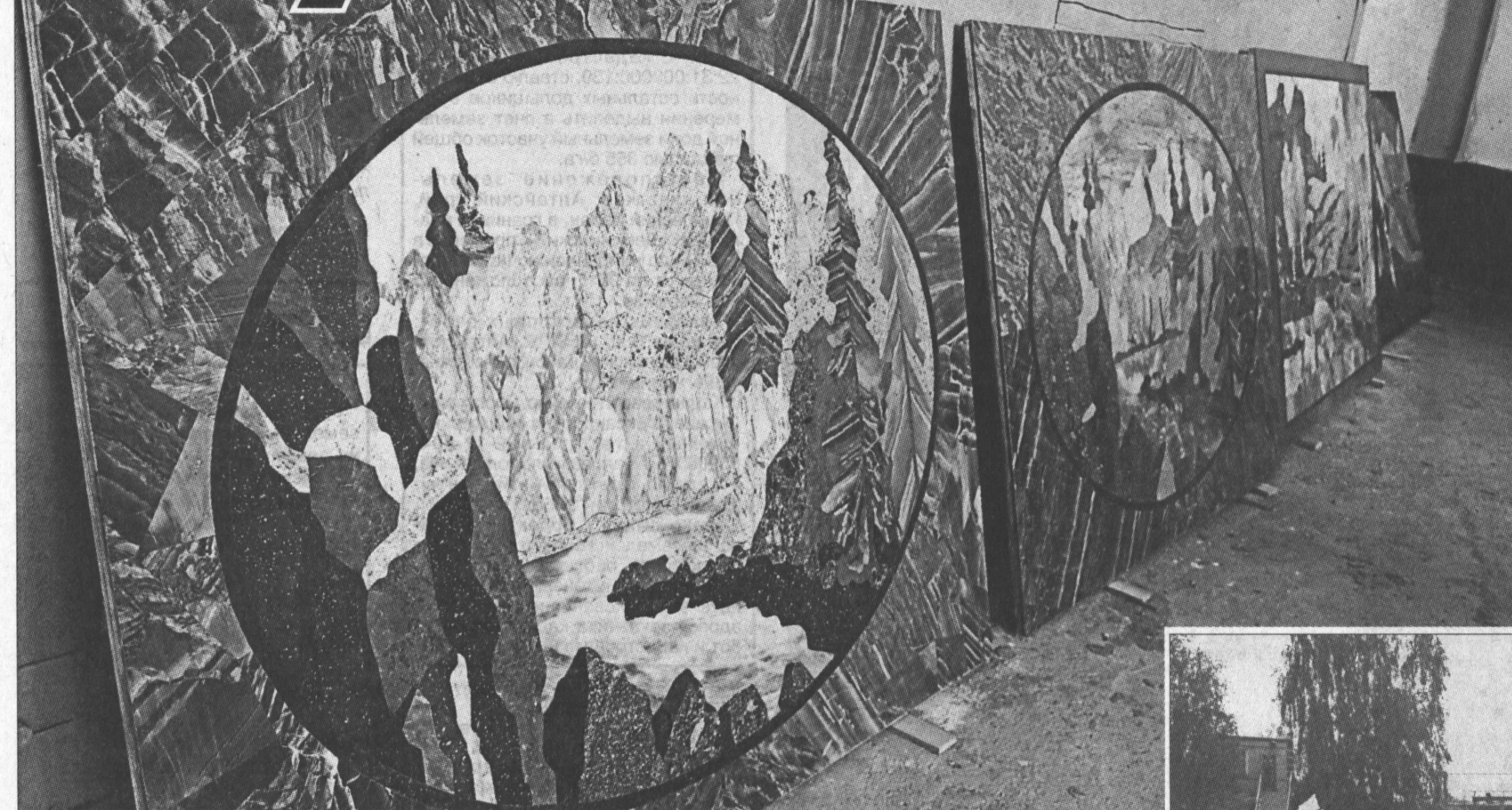
Таких размеров каменные картины в России никто не делает.