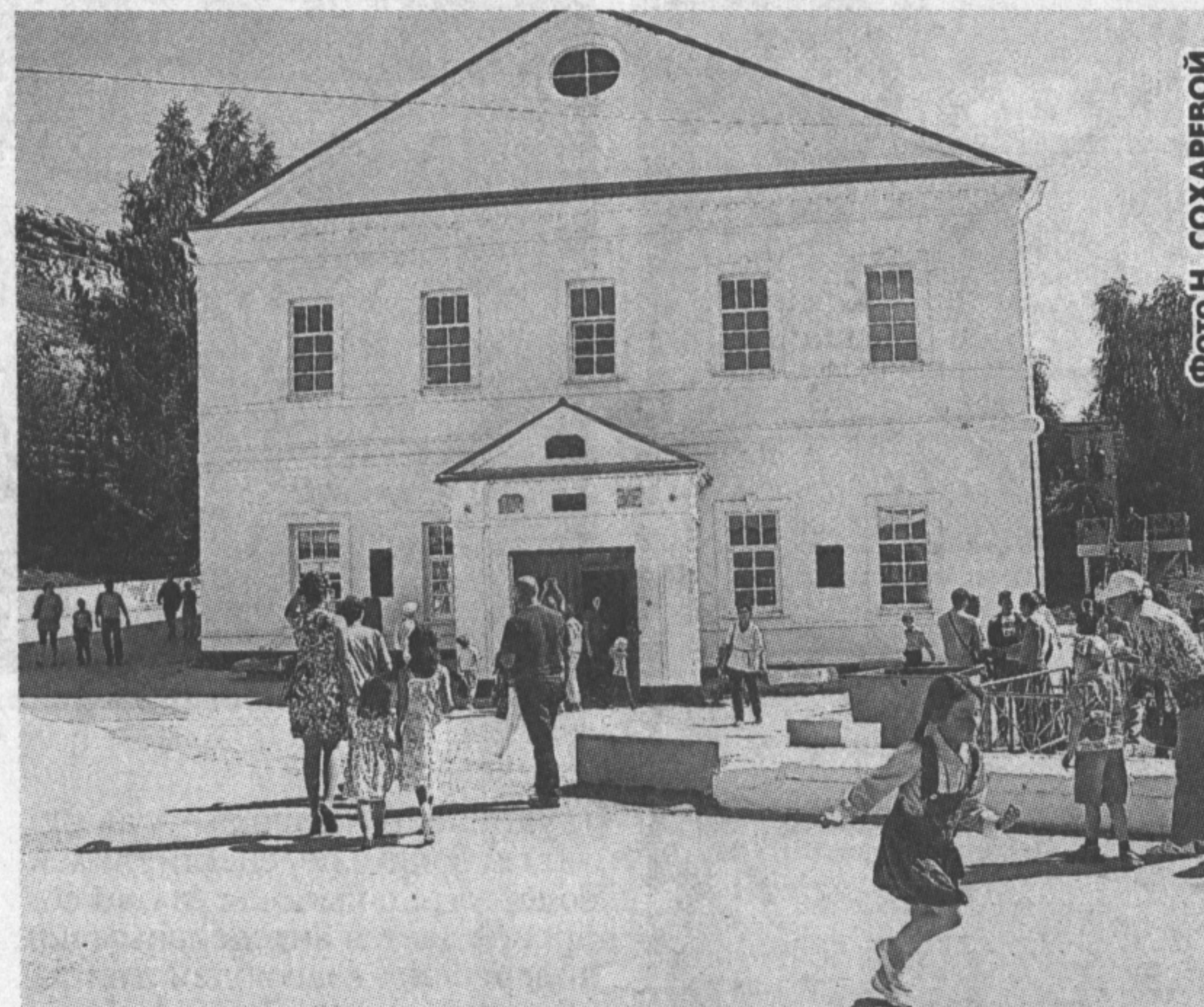
Этот заводской корпус помнит Ивана Ползунова. Наш великий земляк работал на Колыванском медеплавильном заводе в 1761-1762 годах.

Камнерезами не рождаются – ими становятся. Срок обучения – два месяца. А дальше уже сам. Жизнь покажет, ремесленником ты будешь или художником. В камнерезном деле не бывает копий – даже небольшая, с открытку, каменная картинка «Банька», одна из тех, что запу-