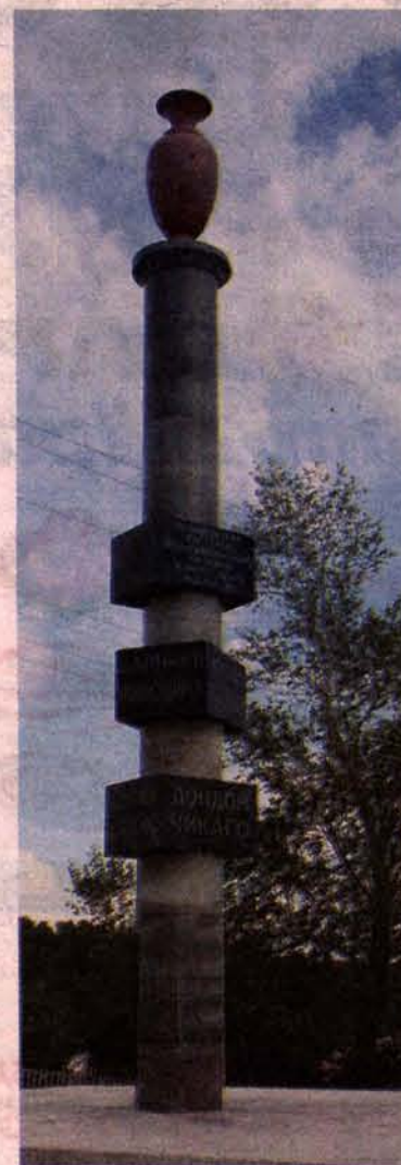
Колонна на въезде в Кольвань. Лондон, Чикаго и другие города — там находятся изделия кольванских мастеров, там восхищаются их искусством.

Благодарим за организацию путешествия КГБУ «Алтайтурцентр». Благодарим за гостеприимство и заботу руководство и персонал баз отдыха «Алтайский журавель» и «Скала» (Змеиногорский район). Благодарим за помощь и поддержку КГКУ «Алтайавтотор».