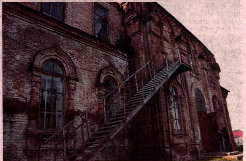
Знаменская церковь в Курье.