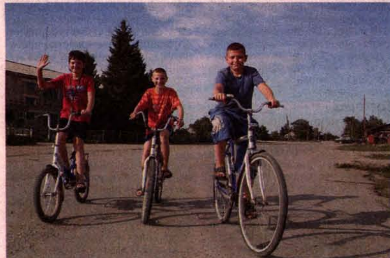
Улица Тракторная в Калмыцких Мысах помнит еще рудовозные обозы.