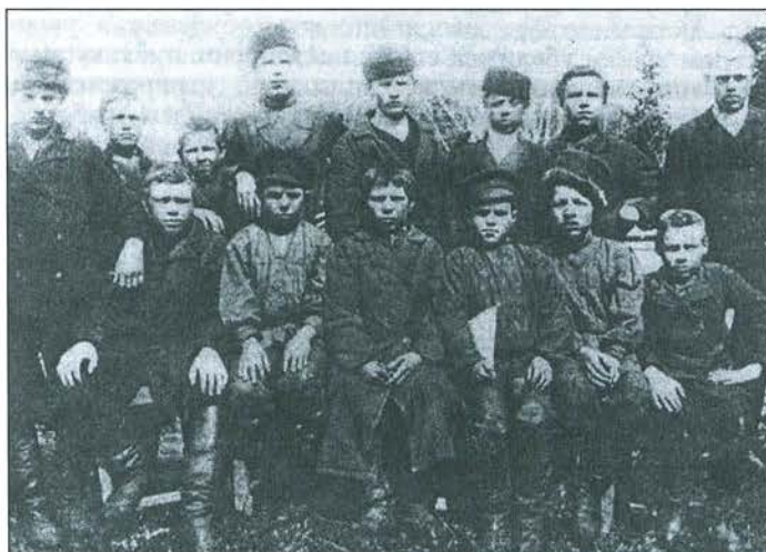
Ученики рисовальной школы

Так, до 50-х гг. XIX в., можно говорить о двух путях приобретения учащимися непосредственных навыков по работескамнем. Первый заключался в получении практических умений подростками во время их нахождения в ка-