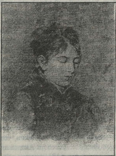
Женский портрет. Бум., кар. 1908. Учебный рисунок. Горная Колывань

Исходя из вышеотмеченных фактов автор данной работы пришел к выводу, что обучение мастеров до открытия горнозаводской