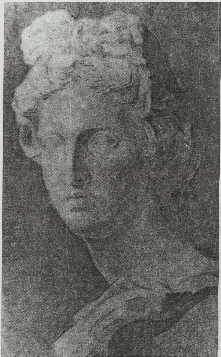
Аполлон Бельведерский, рисовал Ивачев. 1862 год. Кар. 1/2 л.