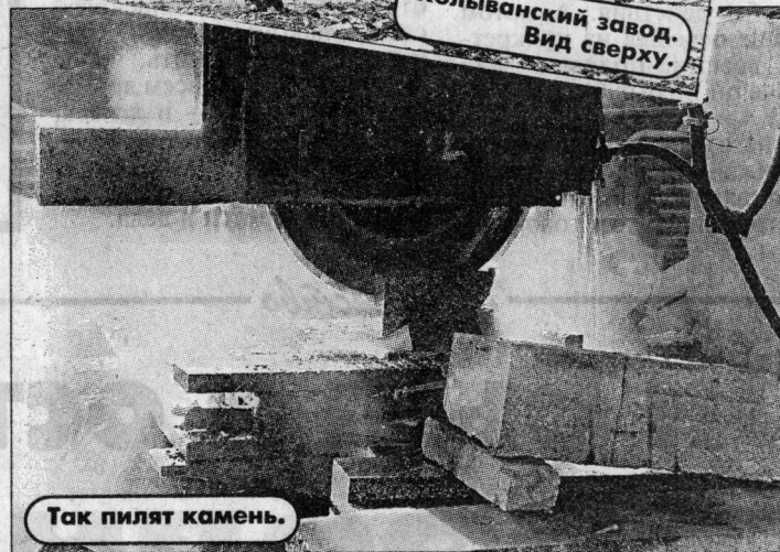
Так пилят камень.