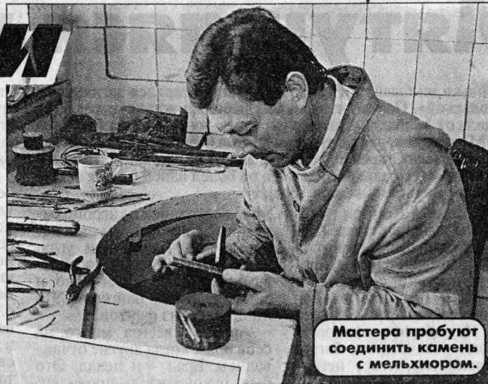
Мастера пробуют соединить камень с мельхиором.

(тоже, естественно, не деревянные) к нему купил. Есть что присмотреть для себя или своих знакомых и людям с небольшим достатком.