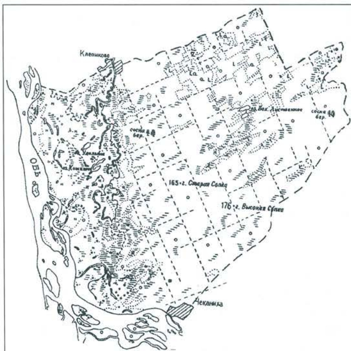
Карта-схема Обского заказника

Государственный природный комплексный (ландшафтный) заказник краевого значения