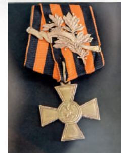
Георгиевский крест. Фото с выставки — Александр Волобуев.

Сохранились документы, указывающие на то, что в Барнауле предполагалось построить завод по переработке животных останков для производства желтой кровяной соли, которая, в свою очередь, использовалась для производства газа синильной кислоты. Первой применила химическое оружие Германия, а затем и Россия. С лета 1915 года велась активная переписка между томским отделением военно-химического комитета и барна-