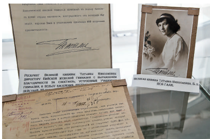
Рескрипт княжны Татьяны Николаевны с ее подписью. Она благодарит учеников Бийской мужской гимназии, собравших деньги для нуждающихся и пострадавших от войны.

плону, по крайней мере, не была ужасной. Пленным разрешалось передвигаться по городу (Барнаулу) в светлое время суток, но запрещалось посещать увеселительные заведения, кондитерские, собрания. Через Красный крест пленные могли послать карточку родным и получать посылки и денежные переводы из дома. В местах пленения они могли работать по профессии и даже получать за это жалованье — и работали врачами, сапожниками, сторожами, черно-рабочими. Алтайским крестьянам разрешалось нанимать пленных в работники. В документе найма оговаривалось, на каких условиях крестьянин берет пленного: крестьяне должны были обувать и одевать своих работников в холодное время года, обеспечить крышу над головой и питание. Сохранился весьма любопытный документ: групповая крестьянская жалоба, в которой крестьяне спрашивают у власти, что делать