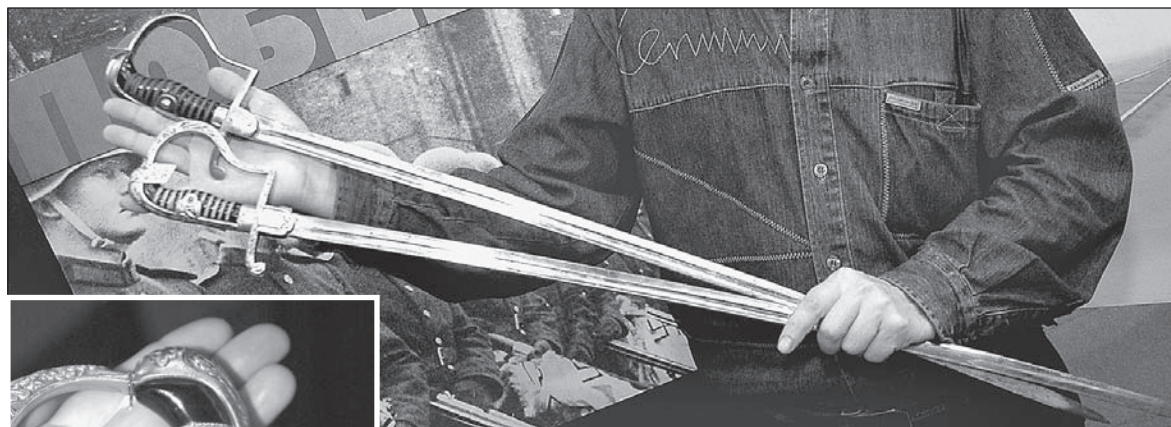
Сабли и эфес парадной сабли для немецких офицеров – с ними командиры вермахта собирались пройти торжественным маршем по Красной площади. Сабли были найдены в обозе после разгрома немцев и привезены в Барнаул одним из бойцов как трофей. Переданы в военно-исторический отдел потомками солдата.