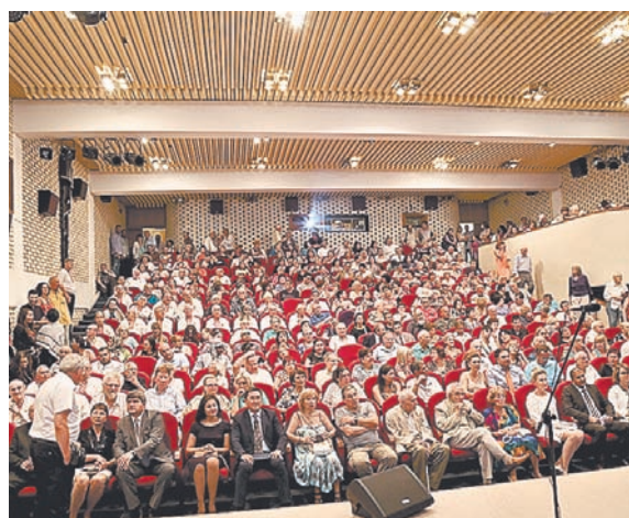
Открытие прошло при полном аншлаге.