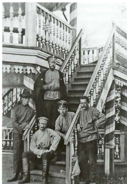
Вячеслав Шишков в Ольгинском саду, г. Бийск. 1913 г.

рублей. Во главе партии, по всем вероятностям, станет старший техник путей сообщения В.Я.Шишков, производивший исследования бассейнов рек Бии и Нижней Тунгуски на севере Сибири». Еще одна выдержка из той же газеты, только за другое число: «По распоряжению министерства путей сообщения в текущем году организована партия для исследования Чуйского тракта с целью выяснения всех его дефектов. В настоящее время там ведутся работы изыскательской партии Томского округа путей сообщения. Работы второй группы начались постановкой полевого пикета на левом берегу реки Бии у пристани Бийского городского перевоза. В селе Алтайском нивелировка связана с астрономическим пунктом. Работы первой группы начались от Кош-Агача. С 3-го июля работы открылись в полном составе при достаточном числе техников, рабочих и геодезических инструментов».