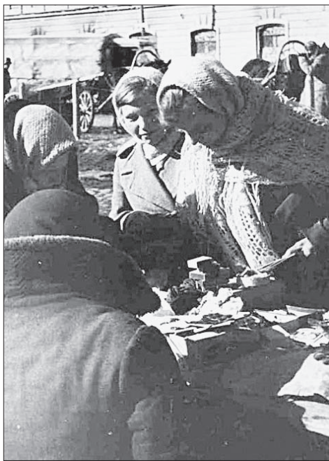
На «черном рынке» военных лет купить можно было все. Имелись бы деньги...

Русской православной церковью было собрано свыше 250 миллионов рублей, переданных на нужды обороны. От заключенных ГУЛАГа в фонд обороны поступило: в 1941 году – 250 тысяч рублей, в 1942 – свыше 2-х миллионов, в 1943-1944 годах – 25 миллионов рублей.