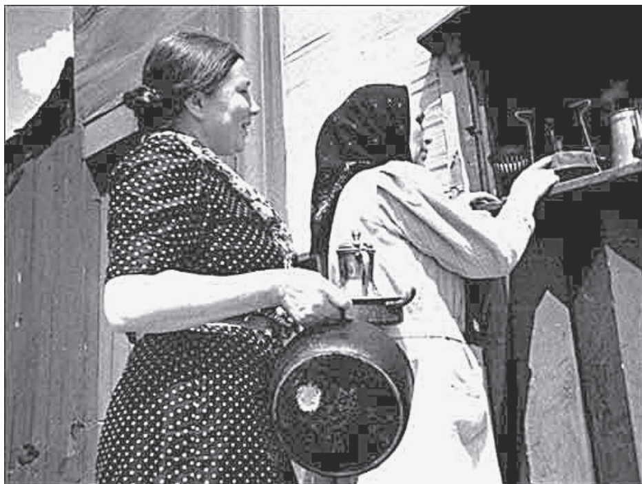
Москва, 1941 г. Домохозяйки сдают металлолом для нужд обороны страны.