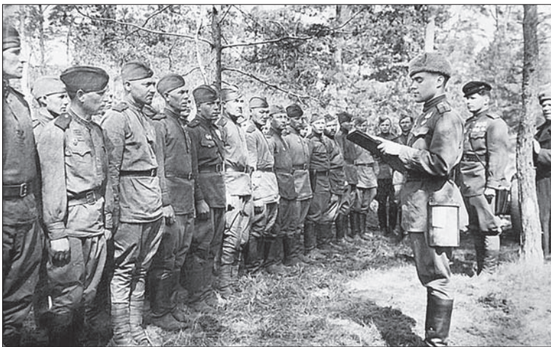
Одерский плацдарм. Перед штурмом Берлина. Апрель 1945 г.

— В январе 1944 года мы наступали на Новгород. Провели артподготовку, потом пошли в атаку. Вечером заняли первую траншею немцев. Расположились командным составом в офицерском блиндаже, с нами несколько разведчиков. Легли спать, а перед этим хорошо поели и выпили. Понадеялись, что боевое охранение, как обычно, выставит пехота. А она ушла дальше. Там комполк убило, его зам по строевой тоже, командование перешло